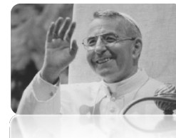
Venerabile Albino Luciani - Papa Giovanni Paolo I

Foglio settimanale delle Parrocchie di SAN SIMONE APOSTOLO VALLADA AGORDINA SAN GIOVANNI BATTISTA CANALE D'AGORDO