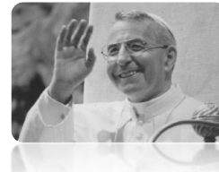
Venerabile Albino Luciani - Papa Giovanni Paolo I

Vieni, Gesù attende anche TE! Venerdì a Vallada 7-21 Canale 15-18