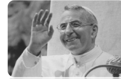
Venerabile Albino Luciani - Papa Giovanni Paolo I

Foglio settimanale delle Parrocchie di SAN SIMONE APOSTOLO VALLADA AGORDINA SAN GIOVANNI BATTISTA CANALE D'AGORDO