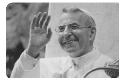
Venerabile Albino Luciani - Papa Giovanni Paolo I

Foglio settimanale delle Parrocchie di SAN SIMONE APOSTOLO VALLADA AGORDINA SAN GIOVANNI BATTISTA CANALE D'AGORDO