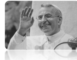
Venerabile Albino Luciani - Papa Giovanni Paolo I

Foglio settimanale delle Parrocchie di SAN SIMONE APOSTOLO VALLADA AGORDINA SAN GIOVANNI BATTISTA CANALE D'AGORDO