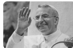
Beato Giovanni Paolo I, papa

Foglio settimanale parrocchie VAL BIOIS SAN GIOVANNI BATTISTA - CANALE SAN SIMONE APOSTOLO - VALLADA MADONNA DELLA SALUTE - CAVIOLA SAN SEBASTIANO MARTIRE - FALCADE