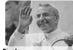
Beato Giovanni Paolo I, papa

Foglio settimanale parrocchie VAL BIOIS SAN GIOVANNI BATTISTA - CANALE SAN SIMONE APOSTOLO - VALLADA MADONNA DELLA SALUTE - CAVIOLA SAN SEBASTIANO MARTIRE - FALCADE