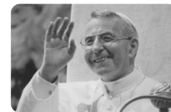
Beato Giovanni Paolo I, papa

Foglio settimanale parrocchie VAL BIOIS SAN GIOVANNI BATTISTA - CANALE SAN SIMONE APOSTOLO - VALLADA MADONNA DELLA SALUTE - CAVIOLA SAN SEBASTIANO MARTIRE - FALCADE